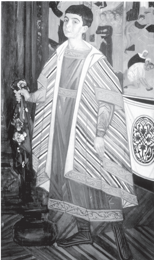
Портрет графа Ю.И. Олсуфьева. 1913 г.

В 1925 г. во Франции Д.С. Стеллецкого избрали в совет общества «Икона», изучавшего древние иконы, проводившего выставки иконописцев и объединявшего ценителей русской старины. В 1931 г. Стеллецкий помог созданию Русского культурно-исторического музея в Праге, оформив его первые издания.