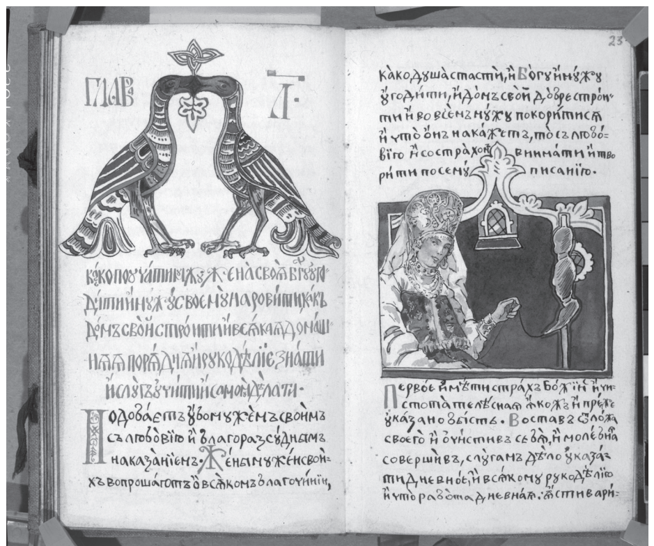
Домострой. Страницы рукописной книги. 1899 г.

Панно, состоящее из четырех картонов — «Утро (Цветы)», «День (Заботы)», «Вечер (Песни)» и «Ночь (Покой)», — выполнено в характер-