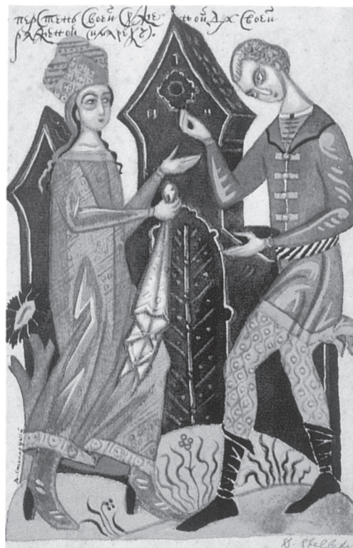
Страница рукописной книжницы «Песня». 1918 г.