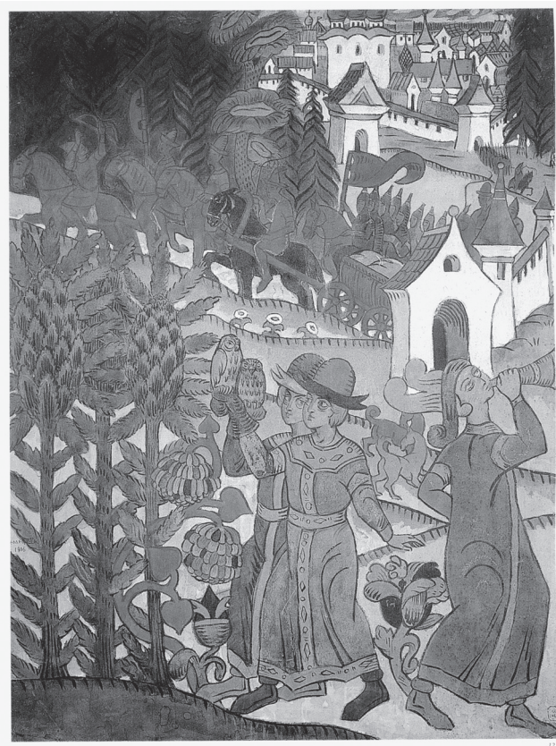
Соколиная охота. Бумага, акварель, гуашь. 1906 г.