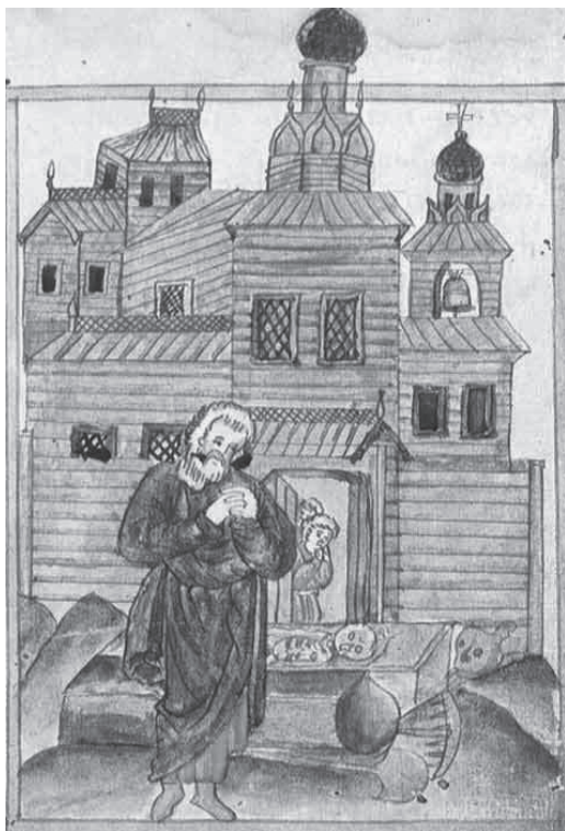
«Зрю ты гробе...». Миниатюра синодика сольбинского Никольского монастыря. XVIII в.