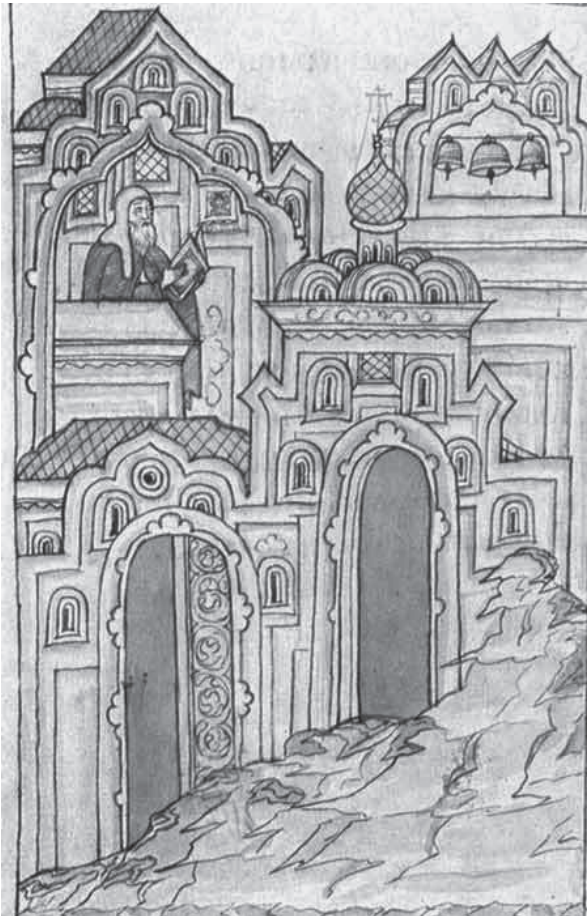
Чтение синодика в церкви. Миниатюра синодика Троицкого Данилова монастыря. 1672 г.

Полемическое острие синодика было направлено не только против ереси антитринитариев, но и в защиту права монастырей на материальные богатства, так как их основным источником были вклады «на помин души». Примером другим православным христианам, видимо, должны